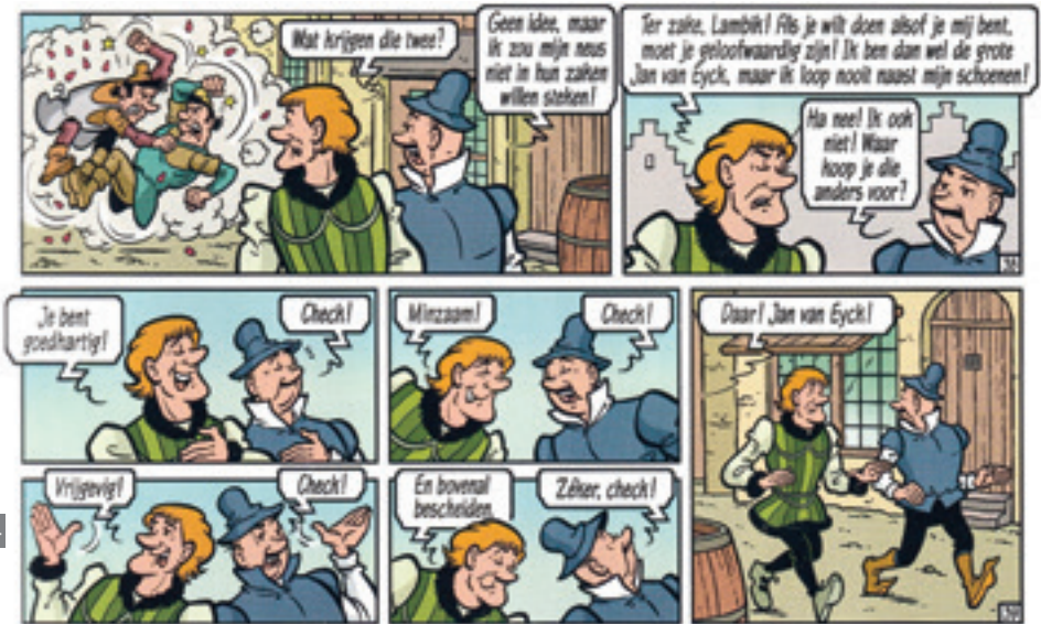
Jan Van Eyck volgens Willy Vandersteen

monumenten onderling te verbinden met het Van Eyckerfgoed als leidraad (Fig.7).