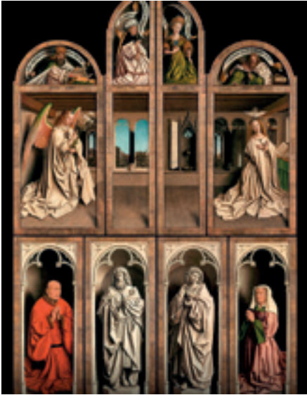
Figuur 1: Lam Gods gesloten toestand

minder eensgezindheid tussen (kunst) historici en theologen. Vertrekken we vanuit het (uitwendig) Gedrag van mensen als reactie op de Gebeurtenis waar ze rond verenigd zijn (III).