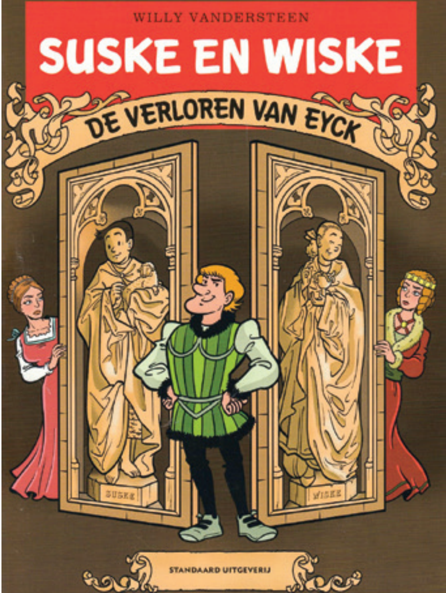
Jan Van Eyck volgens Willy Vandersteen

Ö: ^ Á aá ^ | ä ä * Á æ Æ ä } Á } | ä ä Á | ä ^ !