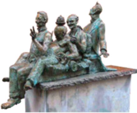
Figuur 5: Het Maaseiker 'Deugdenstandbeeld'