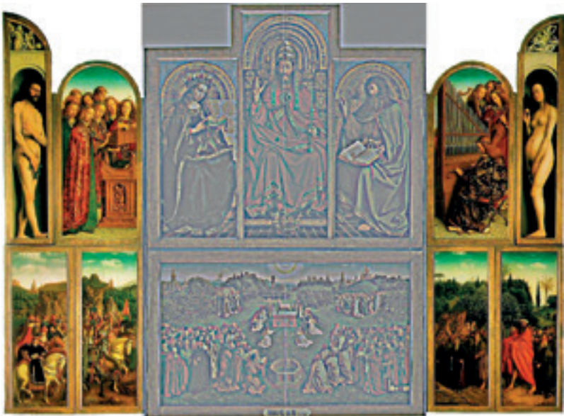
Figuur 3: Lam Gods geopende toestand zijluiken