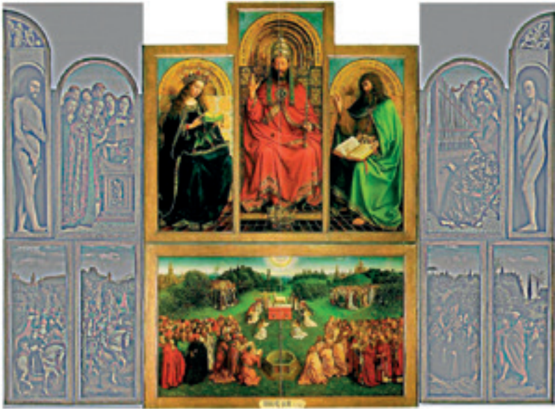
Figuur 2: Lam Gods geopende toestand middenluik