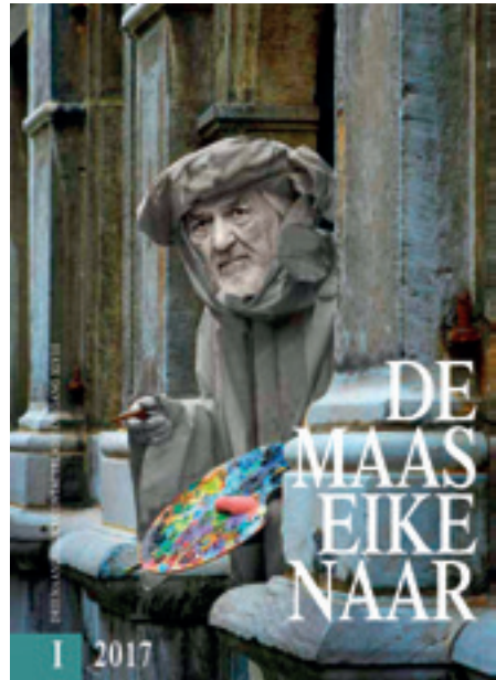
Figuur 4: Cover Maaseikenaar 2017: Meester Herman als Meester Jan (ontwerp Studio Segers)

Het standbeeld van de gebroeders Van Eyck staat in Maaseik op één lijn met het standbeeld van de kardinale deugden (Fig. 4). Geen wonder dus dat uitgerekend in Maaseik die deugden op het Lam Gods in eer hersteld werden. En niet in Brugge, Den Haag, Berlijn of een andere stad met Van Eyck-erfgoed. Gent zal pas tien jaar later aansluiten (12). Waarom duurde dit zo lang? De sleutel ligt bij een derde standbeeld: "De vlooiënkonink". De Maaseiker versie van de kardinale deugden situeert zich in de carnavaleske cultuur. Die vertrekt van de "omgekeerde wereld" (mundus inversus). De deugden worden – overigens pas vanaf de plaatsing van het Van Eyck-standbeeld in de